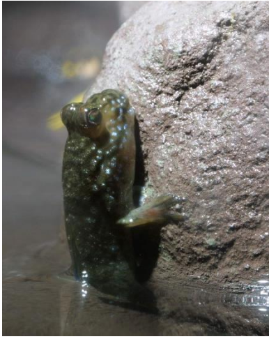
Périophtalme fixé sur un rocher grâce à une ventouse ventrale.